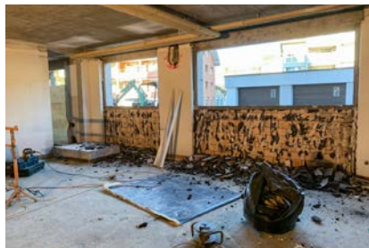
Filiale Sachseln: Die Räumlichkeiten der ehemaligen Poststelle sind bis auf den Rohbau ausgehöhlt.